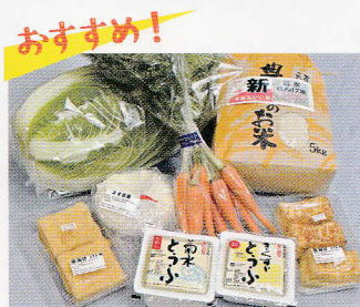
館内で作られるこだわりの豆腐

地元野菜や食材や果物がずらり。何と言っても館内で作られる豆腐は絶品。国産大豆100%に美味しい水や本にがりを使った豆腐はここでしか買えません。厚揚げや、その日にしか並ばない商品もあり、うま味を大切に販売しています。