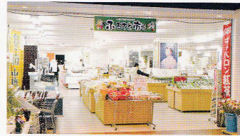
特典がお得・YouYouカード

山鹿市山鹿温泉プラザ山鹿1F tel. 0968-44-0577 営 9:30~19:00 休 不定休、1/1、1/2 ※12/31は17:00まで