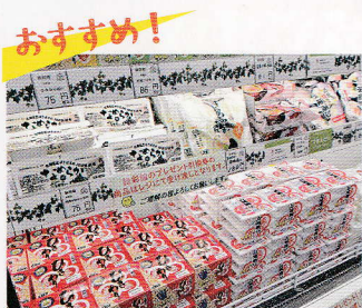
丸美屋の工場から直送された納豆・豆腐

「お城納豆」でお馴染みの丸美屋の豆腐・納豆などがおすすめです。直売店ということもあり、工場から直送された新しい商品を直売店価格で購入できます。お得なセット販売も行っております。新商品の赤豆納豆もぜひお試しください。