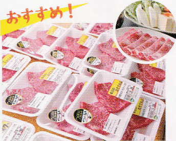
すき焼きにおすすめ!やまが和牛

当館でしか取り扱いのない、きめ細やかなサシと甘みが特徴の「やまが和牛」。冬はスライスのすき焼きが最高です。切り落としには色んな部位が入っておりこれもまた絶品です。JAブランド豚肉「りんどうポーク」のみを100%使用したオリジナルハンバーグは数量限定で大人気です。