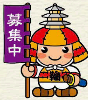
鞠智城イメージキャラクター 「ころう君」