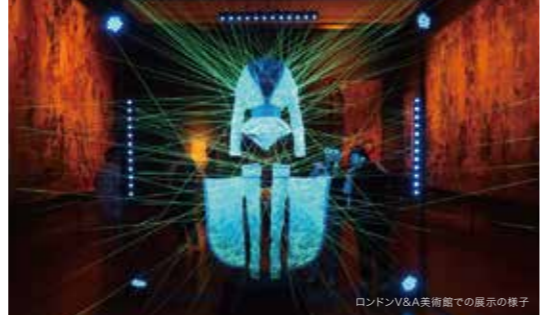
ロンドンV&A美術館での展示の様子

開催日程 2018年8月4日～9月12日/11:30～19:30 (中蔵スペースのみ8月10～11日、24～26日を除く) 開催時間 11:30～19:30 住所 〒861-0501 熊本県山鹿市山鹿1392