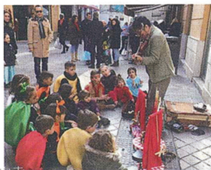
ヨーロッパ各国でのパフォーマンス。どの国でもたくさん笑顔が溢れている。