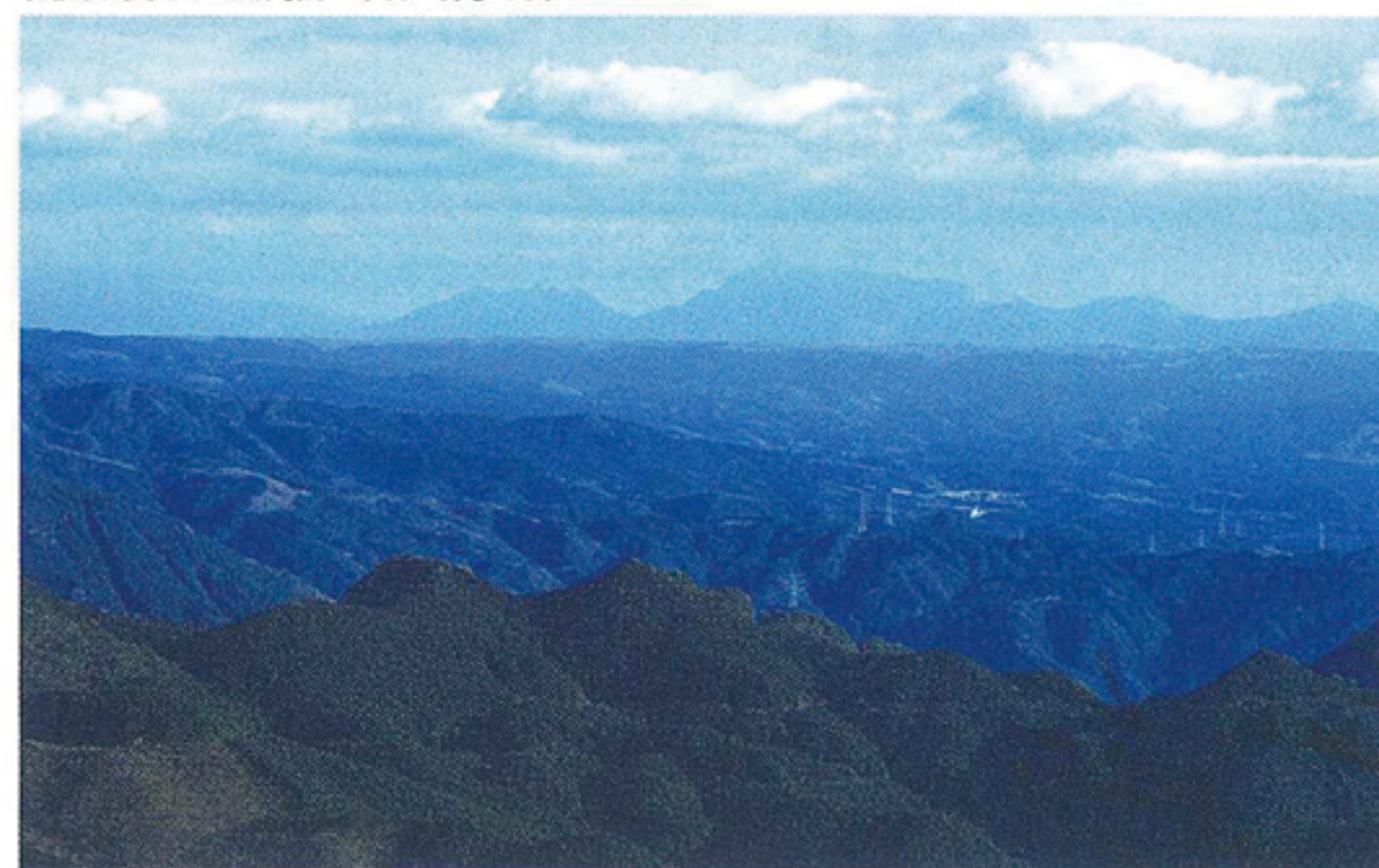
天気良ければ、阿蘇五岳まで見える。