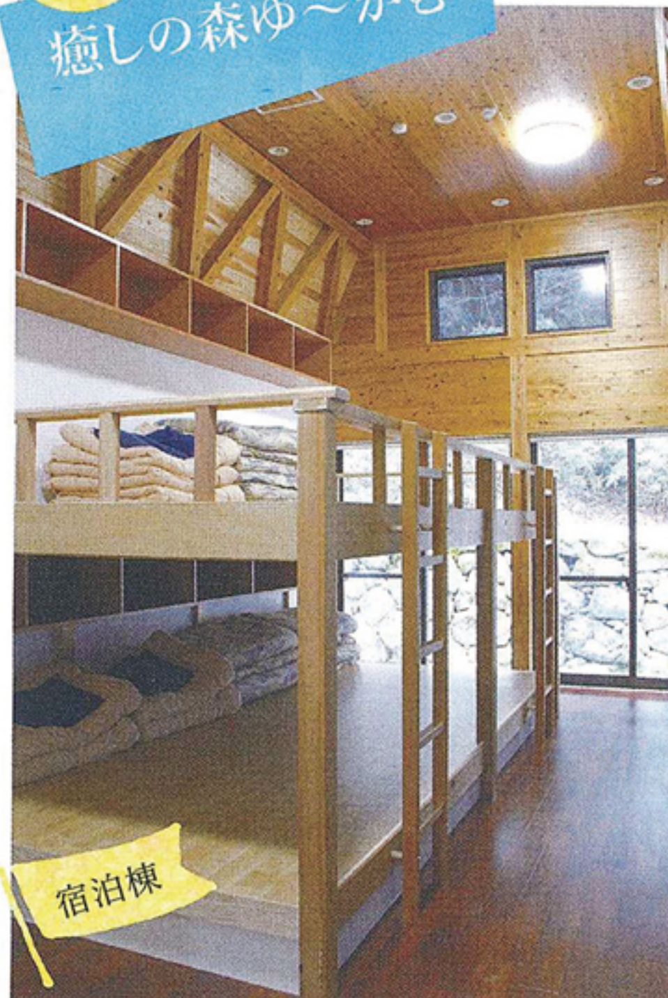
宿泊棟は合宿や研修など人数が多い場合の宿泊にも最適です。

「鹿北に長く滞在することで、この魅力を知って楽しんでほしい」と本田支配人。「スポーツ合宿等、利用が増えるといいですね」。