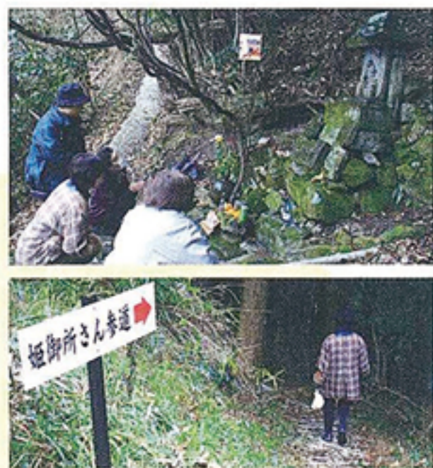
道を整備され行きやすくなりました。