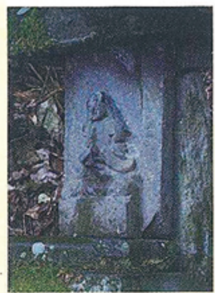
女の人が赤ちゃんを抱いたように見えるやさしい姿の「姫御所さん」。

毎年、1月5日は、柚の木谷集落の女性全員で「姫御所さん」に出向き参拝します。代々、安産の神様として受け継がれており、「お産が近くなると、姫御所さんに参りにいかやんと旦那に連れて行かれるのか」と思いつながら歩きまわりました。「3人目の時は、子どもたちとお参りに行ったのよ」と話してくれました。 三角の形をした男岳(532.2m)と丸い形をした女岳(595.8m)の間に位置する姫御前岳。女岳と姫御前岳の麓にある「姫御所さん」。ぜひ訪れてみてください。