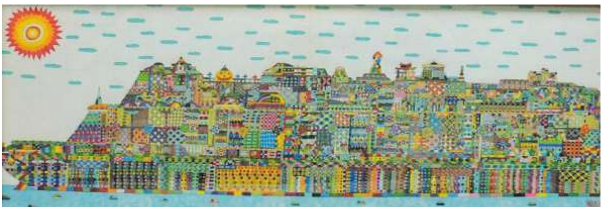
松本 寛庸「豪華客船太陽」