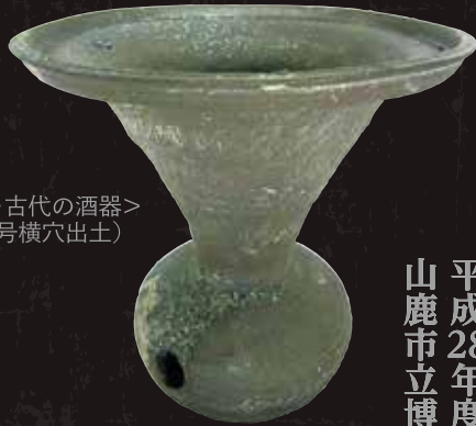
甕くはそう・古代の酒器> (湯の口17号横穴出土)