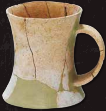
ジョッキ形土器 (方保田東原遺跡出土)